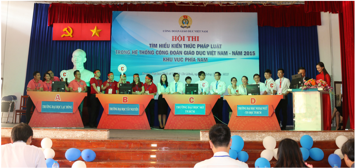
Phần thi Kiến thức pháp luật.

thiệu, Xử lý tình huống và Kiến thức pháp luật. Mở màn với phần thi chào hỏi, các đội đã cho thấy sự sáng tạo, trí tuệ, đa dạng, sự đầu tư công phu về dàn dựng, trang phục nhằm giới thiệu đơn vị mình một cách độc đáo, gây ấn tượng với Ban Giám khảo và khán giả. Phần thi xử lý tình huống dưới hình thức sân khấu hóa, cùng với sự đầu tư kỹ lưỡng, các đội đã chuyển tải nội dung pháp luật một cách sinh động, dễ hiểu, đáp ứng yêu cầu công tác tuyên truyền, phổ biến pháp luật đến nhà giáo và người lao động. Đối