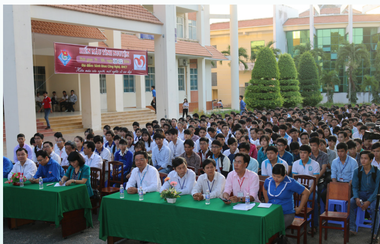
Ngày hội tuyên dương người HMTN và phát động Lễ hội Xuân hồng Trường ĐHTC năm 2016.

Bên cạnh đó, công tác kết nối người hiến máu tham gia phong trào tình nguyện hỗ trợ cộng