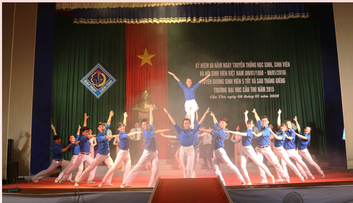
Lễ Kỷ niệm 66 năm Ngày Truyền thống học sinh, sinh viên và Hội Sinh viên Việt Nam (09/01/1950-09/01/2016); Tuyên dương Sinh viên 5 tốt và Sao Tháng Giêng năm 2015 tại Hội trường Lớn.