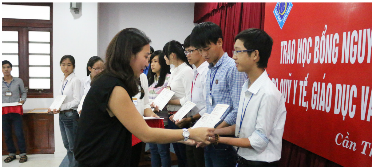
Trao Chứng nhận học bổng cho các em sinh viên.

và 20 em của Trường Đại học Y Dược Cần Thơ được trao các suất học bổng với trị giá mỗi suất là 200 USD. Học bổng Nguyễn Trường Tộ sẽ đồng hành cùng các em sinh viên trong suốt thời gian học tập tại trường với điều kiện các em duy trì kết quả học tập tốt mỗi năm. Đây là năm thứ 2 các em sinh viên Trường ĐHTC được nhận học bổng ý nghĩa này. Hy vọng rằng đây sẽ là món quà đầy ý nghĩa khích lệ lớn lao cả về vật chất lẫn tinh thần để các em tiếp tục vượt khó học tốt.