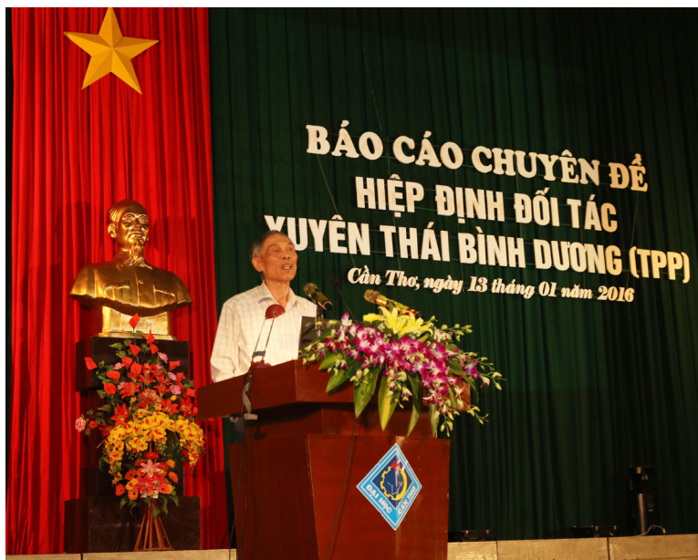
Ông Trương Đình Tuyển, Nguyên Bộ trưởng Bộ Thương mại báo cáo về Hiệp định TPP.

H iệp định đối tác xuyên Thái Bình Dương (TPP) trở thành một Hiệp định quan trọng đặt ra các tiêu chuẩn mới cho thương mại toàn cầu, đồng thời tiếp tục giải quyết các vấn đề của thời đại mới. Hiệp định TPP được coi là hình mẫu cho hợp tác kinh tế khu vực trong những năm đầu của thế kỷ XXI. Để có thêm thông tin và hiểu biết về Hiệp định này, ngày 13/01/2015, Trường Đại học Cần Thơ (ĐHCT) vinh dự mời ông Trương Đình Tuyển, Nguyên Bộ trưởng Bộ Thương mại đến để báo cáo chuyên đề về Hiệp định TPP.