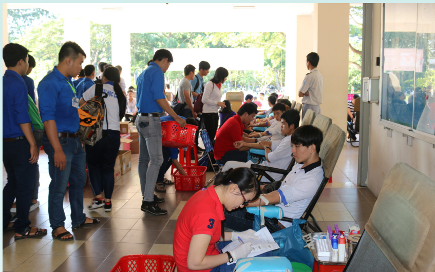
Sinh viên Trường ĐHCT luôn sẵn sàng với hoạt động HMTN.