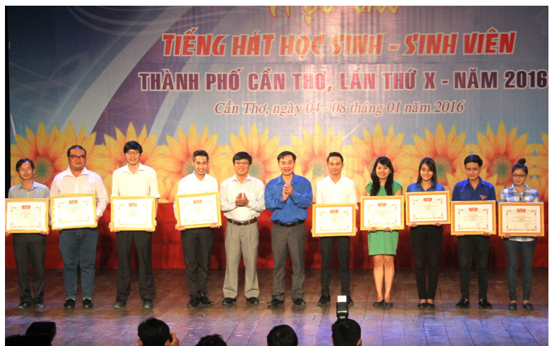
Đại diện Đội văn nghệ Trường Đại học Cần Thơ nhận Giải Nhì toàn đoàn (thứ ba từ trái qua).

“Tổ quốc ơi ta đã nghe”, đơn ca “Hồ trên núi”, Múa “Những bông hoa tiếp bước anh hùng”, 01 giải Nhì (tốp ca “Đảng cho ta cả một mùa xuân”) và 01 giải Ba (ca múa “Đại học Cần Thơ 50 năm một chặng đường”). Với kết quả này, Đội Văn nghệ Trường được xếp hạng Nhì toàn đoàn.