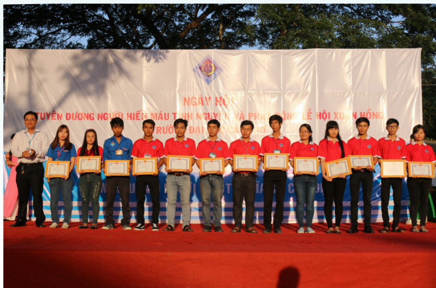
Các cá nhân đã có thành tích xuất sắc trong phong trào HMTN năm 2015 nhận khen thưởng.

Hiến máu cứu người là một nghĩa cử cao đẹp, là phong trào có sức lan tỏa rộng rãi trong toàn xã hội, đặc biệt là trong học sinh, sinh viên. Phong trào hiến máu tình nguyện đã kết nối những tấm lòng nhân đạo, những trái tim sẵn sàng sẻ chia, cứu người trong những tình huống nguy cấp. Cán bộ và sinh viên Trường ĐHCT đã đang và sẽ luôn đi đầu trong công tác tổ chức và hiến máu tình nguyện, góp phần cùng thành phố đảm bảo nguồn máu dự trữ kịp thời cứu chữa người bệnh.