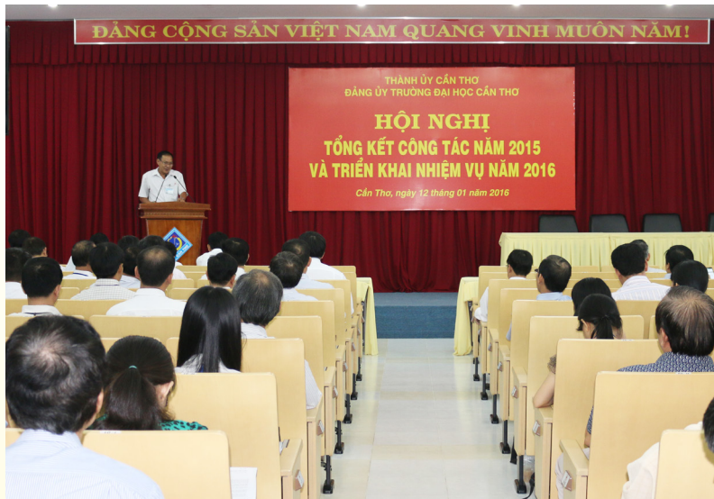
Hội nghị Tổng kết công tác năm 2015 và Triển khai nhiệm vụ năm 2016 của Đảng ủy Trường tại Nhà Điều hành.

Ngày 12/01/2016, Ban Thường vụ Đảng ủy tổ chức Hội nghị Tổng kết công tác năm 2015 và Triển khai nhiệm vụ năm 2016. Tham dự Hội nghị, có các đồng chí trong Ban Chấp hành Đảng bộ và Ban Giám hiệu Nhà trường; các đồng chí đại diện các tổ chức cơ sở Đảng; đại diện lãnh đạo các đơn vị trực thuộc Trường; các đồng chí là thành viên các cơ quan tham mưu, giúp việc của Đảng ủy; báo cáo viên Đảng ủy và các đồng chí được tặng huy hiệu 30 năm, 40 năm tuổi Đảng.