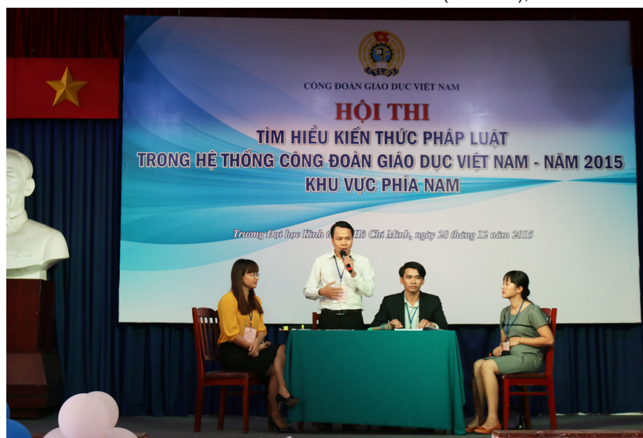
Phần thi Xử lý tình huống.