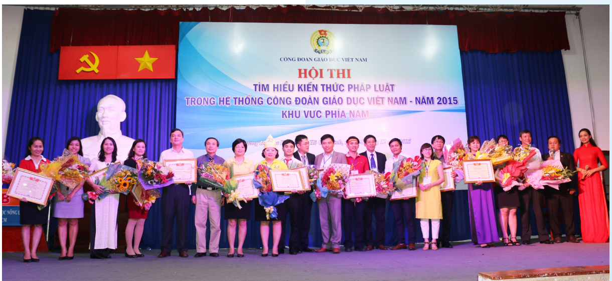
Các đội chụp ảnh lưu niệm.

Về kết quả, do chất lượng Hội thi năm nay khá tốt, Ban Tổ chức đã trao 01 giải Đặc biệt, 02 giải Nhất, 03 giải Nhì, 07 giải Ba, 03 giải khuyến khích và 04 giải phụ cho đội có phần dự thi chào hỏi và xử lý tình huống ấn tượng. CĐ Trường Đại học Cần Thơ đã xuất sắc đạt giải Nhì tại Hội thi.