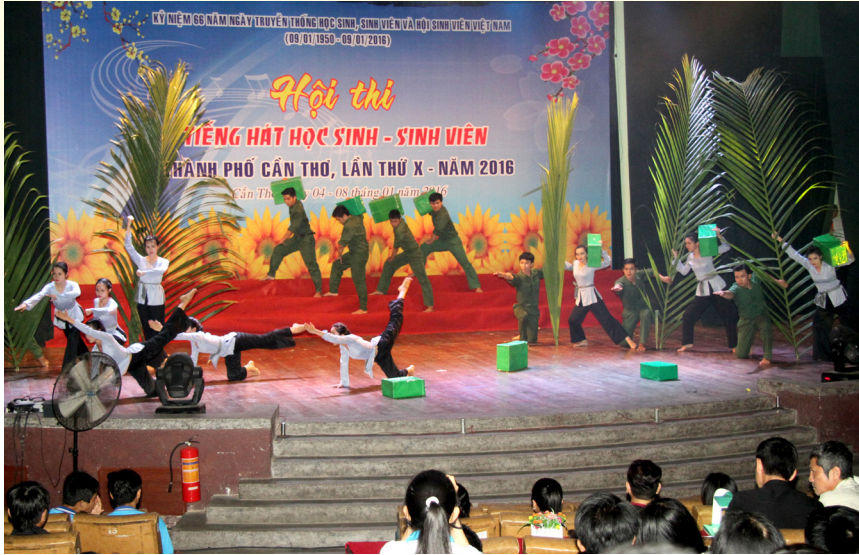
“Những bông hoa tiếp bước truyền thống anh hùng” tiết mục múa đạt giải Nhất.

Từ ngày 04/1 đến 08/1/2016, Hội thi “Tiếng hát học sinh, sinh viên thành phố Cần Thơ lần thứ X-năm 2016” với chủ đề “Học sinh, sinh viên thành phố Cần Thơ tiến bước dưới cờ Đảng” được tổ chức tại Nhà Biểu diễn-Trung tâm Văn hóa thành phố Cần Thơ. Tham gia Hội thi có gần 500 diễn viên đến từ 21 đơn vị là các quận, huyện đoàn; trường đại học, cao đẳng, trung học chuyên nghiệp trên địa bàn thành phố.