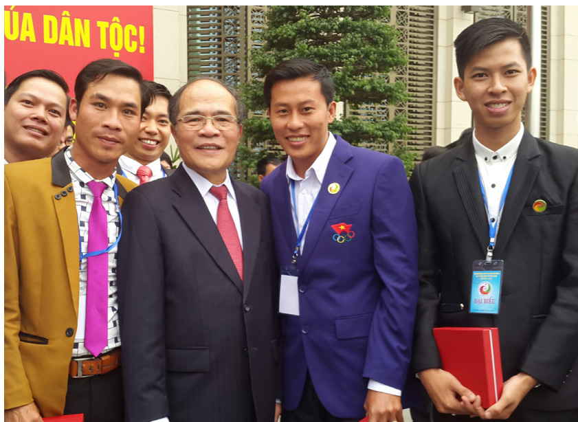
Chụp ảnh lưu niệm với Chủ tịch Quốc hội Nguyễn Sinh Hùng.