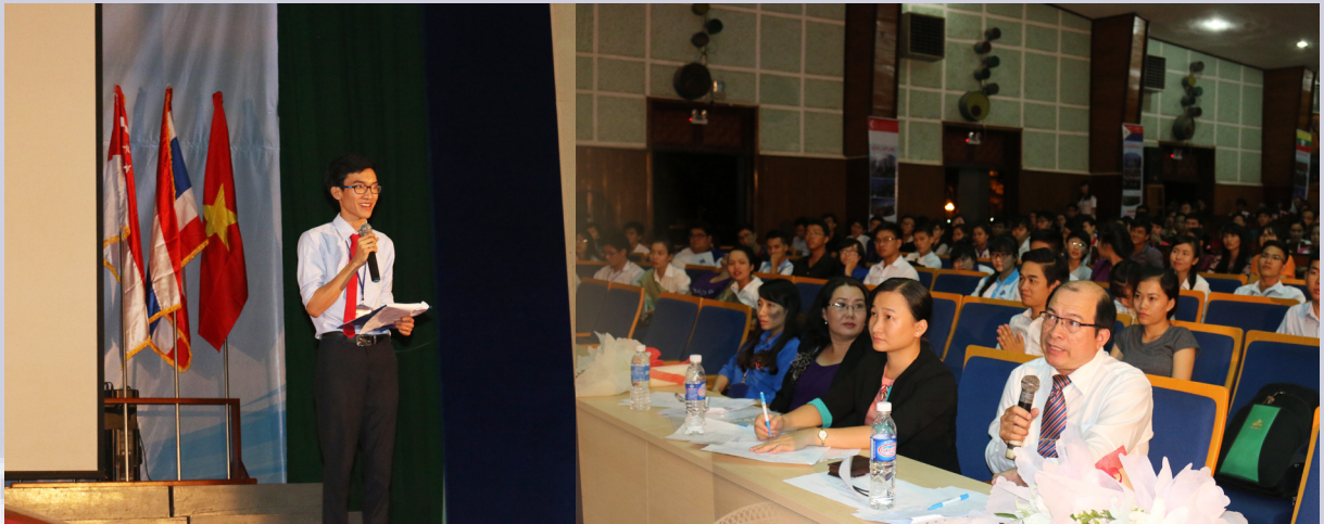
Phản thi vấn đáp của Thí sinh với Ban Giám khảo Cuộc thi.

từ Nhà trường, các em phải chủ động trang bị cho mình vốn ngoại ngữ và kỹ năng cần thiết để hòa nhập vào Cộng đồng ASEAN nói riêng và thế giới nói chung.